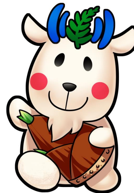
公式キャラクター しもやぎ